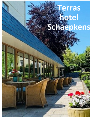
Terras hotel Schaepkens