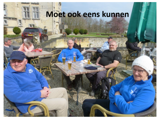
Moet ook eens kunnen