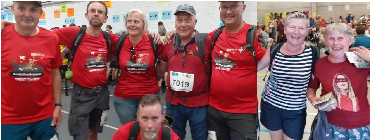
Vóór de start - ze hebben er zin in.