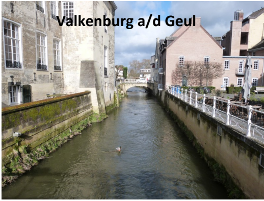
Valkenburg a/d Geul